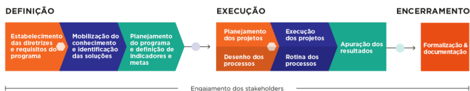
Figura 1- Ciclo de vida do Programa

A etapa de definição do Programa é fundamental para garantir que todas as questões relevantes necessárias para a definição do escopo e dos resultados esperados estejam claramente explicitadas entre a Fundação e as partes interessadas, representadas para este fim pelo CIF e Câmaras Técnicas. A formalização e registro destas definições servirão como base para que os programas sejam dados por encerrados após o término de sua execução.